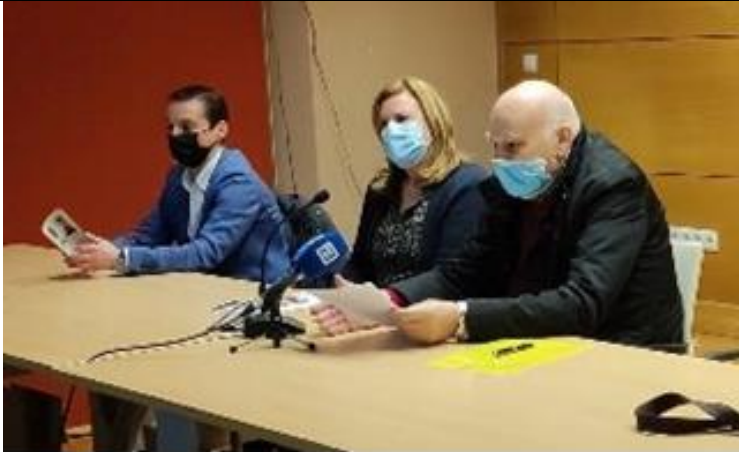
Presentación convocatoria premios 2022

En este apartado iremos incluyendo de forma aleatoria fotos de la historia de la Asociación. La mayoría de ellas se pueden ver también en nuestra WEB en el apartado de FLICK, en el siguiente enlace: https://www.flickr.com/photos/44322988@N06/sets/C