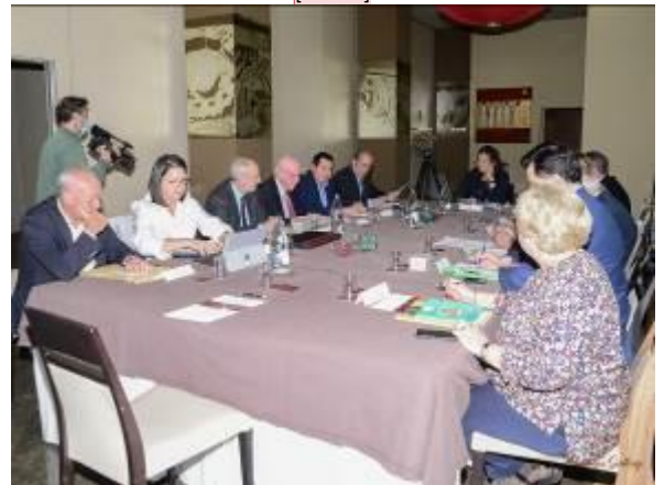
Reunión Jurado Premios 2022