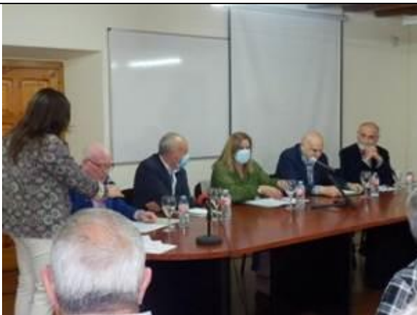
Presentación candidatura Pueblo Ejemplar "Valle de Samuño" 2022