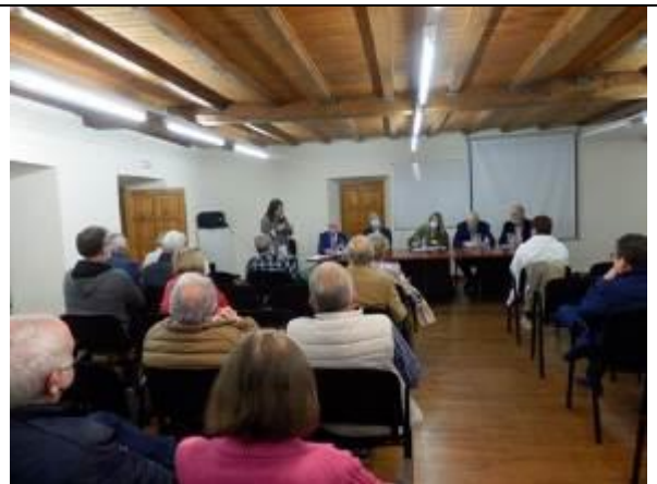
Presentación candidatura Pueblo Ejemplar "Valle de Samuño" 2022