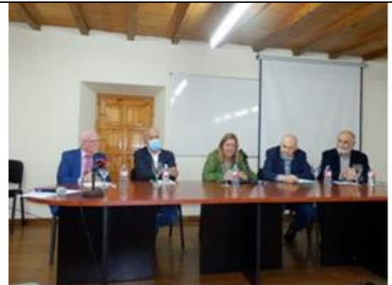
Presentación candidatura Pueblo Ejemplar "Valle de Samuño" 2022